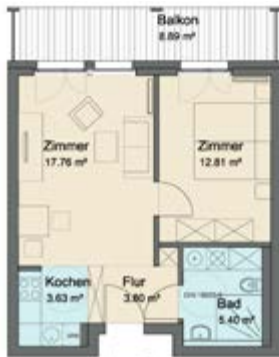
Wohnung Typ 1