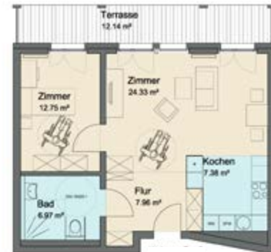
Wohnung Typ 3