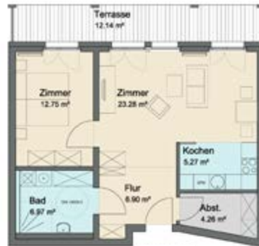
Wohnung Typ 2