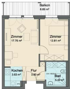
Wohnung Typ 1