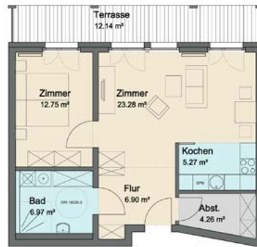
Wohnung Typ 2