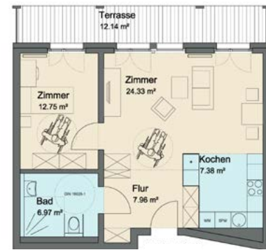
Wohnung Typ 3